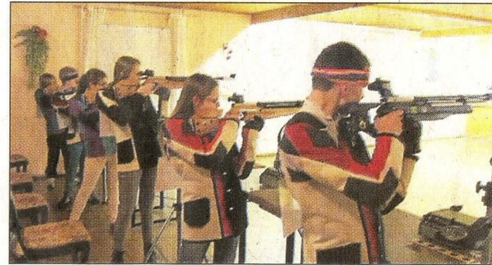
Die jungen Sportschützen sind konzentriert in Dörrielo.

ga-Durchgang mit der Luftpistole für die Teams aus Strange und Kirchdorf findet am Dienstag, 12. Februar, beim Schützenverein Strange-Buchhorst statt. Beginn ist um 18.30 Uhr.